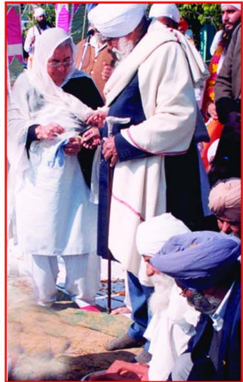
ਗੁਰਦੁਆਰਾ ਈਸ਼ਰ ਪ੍ਰਕਾਸ਼ ਰਤਵਾੜਾ ਸਾਹਿਬ ਦੀ ਨੀਂਹ ਰੱਖਣ ਸਮੇਂ ਪਿਆਰੇ ਮਹਾਂਪੁਰਸ਼ ਅਤੇ ਸਤਿਕਾਰਯੋਗ ਮਾਤਾ ਜੀ।

ਵਿਰਸੇ ਵਿਚੋਂ ਹੀ ਬੀਜੀ ਨੂੰ ਗੁਰਸਿੱਖੀ ਦੇ ਸੁਨਹਿਰੀ ਪਰਪੱਕ ਅਸੂਲਾਂ ਨੂੰ ਅਪਨਾਉਣ ਤੇ ਹੋਰਨਾਂ ਨੂੰ ਇਸ ਉਤੇ ਚੱਲਣ ਲਈ ਪ੍ਰੇਰਨਾ ਕਰਨ ਵਾਲਾ ਸੁਭਾਅ ਪ੍ਰਾਪਤ ਹੋਇਆ ਹੈ। ਪੁਰਾਣੇ ਸਮੇਂ ਮੁਤਾਬਿਕ ਛੋਟੀ ਉਮਰ ਵਿਚ ਹੀ ਸ਼ਾਦੀ ਦਾ ਰਿਵਾਜ ਹੋਣ ਕਰਕੇ, ਮਹਾਂਪੁਰਖਾਂ ਨਾਲ ਸ਼ਾਦੀ ਹੋਣ ਉਪਰੰਤ ਆਪ ਧਮੋਟ ਵਿਖੇ ਆ ਗਏ ਸਨ। ਸਹੁਰੇ ਪਰਿਵਾਰ ਵਿਚ ਆਪਣੇ ਸੁਘੜ ਤੇ ਧੀਰਜਮਈ ਸੁਭਾਅ ਦੁਆਰਾ ਆਪਣੇ ਆਪ ਨੂੰ ਹਰਮਨਪਿਆਰਾ ਬਣਾ ਲਿਆ ਸੀ। ਘਰੇਲੂ ਕਾਰਜਾਂ ਨੂੰ ਕੁਸ਼ਲਤਾ, ਨਿਪੁੰਨਤਾ ਤੇ ਜ਼ਿੰਮੇਵਾਰੀ ਨਾਲ ਨਿਭਾਉਣ ਸਦਕਾ ਆਪ ਪਰਿਵਾਰ ਵਿਚ ਇਸ ਤਰ੍ਹਾਂ ਘੁਲ ਮਿਲ ਜਾਂਦੇ ਕਿ ਆਪ ਨੂੰ ਮਹਾਂਪੁਰਖਾਂ ਦਾ ਪਤਾ ਨਹੀਂ ਸੀ ਰਹਿੰਦਾ ਕਿ ਕਿਥੇ ਗਏ ਹਨ ਕਿਉਂਕਿ ਮਹਾਂਪੁਰਖ ਬਚਪਨ ਤੋਂ ਹੀ ਸੁਤੰਤਰ ਬਿਰਤੀ ਹੋਣ ਕਰਕੇ, ਨਾਮ ਅਭਿਆਸ ਤੇ ਇਕਾਂਤ ਨੂੰ ਪਸੰਦ ਕਰਦੇ ਸਨ ਤੇ ਅਕਸਰ ਕਈ-ਕਈ ਮਹੀਨੇ, ਘਰੋਂ ਬਾਹਰ ਰਹਿੰਦੇ ਸਨ। ਬੀਜੀ ਨੇ ਕਦੇ ਵੀ ਉਨ੍ਹਾਂ ਦੀ ਇਸ ਇੱਛਿਆ ਦੀ ਵਿਰੋਧਤਾ ਨਹੀਂ ਸੀ ਕੀਤੀ ਸਗੋਂ ਇਸ ਵਿਚ ਖੁਸ਼ੀ ਮਹਿਸੂਸ ਕਰਦਿਆਂ ਹੋਇਆਂ ਖਿੜੇ ਮੱਥੇ ਰਹਿੰਦੇ ਸਨ ਅਤੇ ਆਪਣੇ ਆਪ ਨੂੰ ਵਡਭਾਗੀ ਸਮਝਦੇ ਸਨ ਕਿ ਉਨ੍ਹਾਂ ਦੇ ਜੀਵਨ ਸਾਥੀ ਨਾਮ ਰਸੀਏ, ਉਚੀ ਆਤਮਿਕ ਅਵਸਥਾ ਵਾਲੇ ਪਰਉਪਕਾਰੀ ਅਤੇ ਗੁਰਮਤਿ ਗਾਡੀ ਰਾਹ ਦੇ ਪੰਧਾਊ ਹਨ। ਮਹਾਂਪੁਰਸ਼ਾਂ ਦੇ ਕੀਰਤਨ-ਰਸ ਮਾਨਣ ਵਿਚ ਆਪ ਨੂੰ ਜੋ ਪ੍ਰਸੰਨਤਾ ਮਹਿਸੂਸ ਉਦੋਂ ਹੁੰਦੀ ਸੀ, ਉਹ ਹੁਣ ਵੀ ਉਸੇ ਤਰ੍ਹਾਂ ਮਹਿਸੂਸ ਕਰਦੇ ਹਨ ਅਤੇ ਅਕਸਰ ਕਿਹਾ ਕਰਦੇ ਹਨ ਕਿ ਇਨ੍ਹਾਂ ਦਾ ਕੀਰਤਨ ਤਾਂ ਰੱਬੀ ਕੀਰਤਨ ਹੁੰਦਾ ਹੈ।