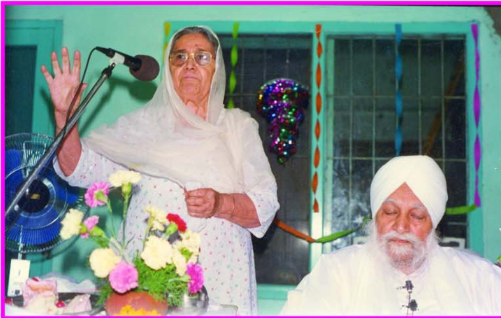
ਸਤਿਕਾਰਯੋਗ ਮਾਤਾ ਜੀ ਪ੍ਰਵਚਨ ਕਰਦੇ ਹੋਏ।

ਵੱਡੇ ਮਹਾਰਾਜ ਜੀ ਰਾੜਾ ਸਾਹਿਬ ਵਾਲਿਆਂ ਦਾ ਹੁਕਮ ਪਾ ਕੇ ਜਦੋਂ ਮਹਾਂਪੁਰਖ ਦਿੱਲੀ ਤੋਂ ਵਾਪਸ ਪਟਿਆਲੇ ਆਏ ਤੇ ਫੌਜ ਦੀ ਸਰਵਿਸ ਕੀਤੀ ਤਾਂ ਬੀਬੀ ਜੀ ਵੀ ਪਟਿਆਲੇ ਆ ਗਏ ਤੇ ਉਸ ਤੋਂ ਬਾਅਦ ਚੰਡੀਗੜ੍ਹ ਆ ਗਏ। ਰਾੜਾ ਸਾਹਿਬ ਵਾਲੇ ਵੱਡੇ ਮਹਾਰਾਜ ਜੀ ਦੇ ਦੀਵਾਨ ਹਰ ਸਾਲ ਚੰਡੀਗੜ੍ਹ ਲਗਦੇ ਸਨ। ਇਹ ਉਪਰਾਲਾ ਮਹਾਂਪੁਰਖਾਂ ਦੇ ਉਦਮ ਤੇ ਪਰਉਪਕਾਰੀ ਸੁਭਾਅ ਵਸ ਹੁੰਦਾ ਸੀ ਤਾਂ ਜੋ ਇਥੇ ਵੀ ਸੰਗਤਾਂ ਦਾ ਭਲਾ ਹੋਵੇ। ਉਸ ਦੌਰਾਨ ਮਹਾਰਾਜ ਜੀ ਆਪ ਦੇ ਗ੍ਰਹਿ ਵਿਖੇ ਹੀ ਠਹਿਰਦੇ ਤੇ ਉਚੇਚੇ ਤੌਰ ਤੇ ਉਨ੍ਹਾਂ ਲਈ ਨਿਵੇਕਲੀ