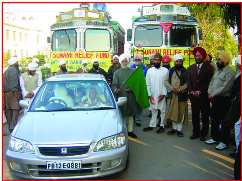
ਸਤਿਕਾਰਯੋਗ ਸੰਤ ਮਾਤਾ ਜੀ ਤਾਮਿਲਨਾਡੂ ਵਿੱਚ ਆਈਆਂ ਸੁਨਾਮੀ ਲਹਿਰਾਂ ਪ੍ਰਭਾਵਿਤ ਇਲਾਕੇ ਵਿੱਚ ਰਤਵਾੜਾ ਸਾਹਿਬ ਤੋਂ 2004 ਵਿੱਚ ਰੀਲੀਫ ਫੰਡ ਟਰੱਕਾਂ ਰਾਹੀਂ ਰਵਾਨਾ ਕਰਦੇ ਹੋਏ।