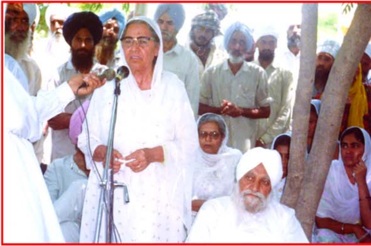
ਸਤਿਕਾਰਯੋਗ ਮਾਤਾ ਜੀ ਪੰਜਾਬ ਵਿੱਚ 1993 'ਚ ਆਏ ਹੜ੍ਹਾਂ ਦੌਰਾਨ ਲੋਕਾਂ ਨੂੰ ਧਰਵਾਸ ਦਿੰਦੇ ਹੋਏ।